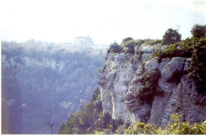
Masia del Cerdà